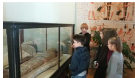
Vizita la Muzeul de etnografie Franz Binder