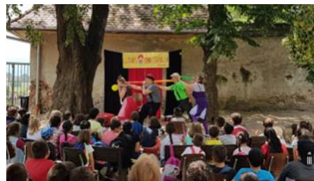
Spectacol teatru—Clowni fara Frontiere