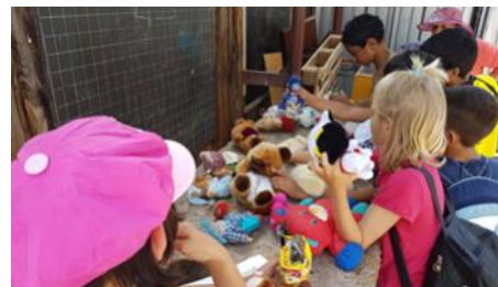
Cadouri si jucarii la Centrul de Zi ARAPAMESU