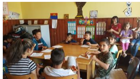
Surprize—sarbatorirea zilelor de nastere.