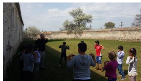
Jocuri in aer liber—activitati sportive