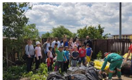
Ecologizare cartier Gusterita