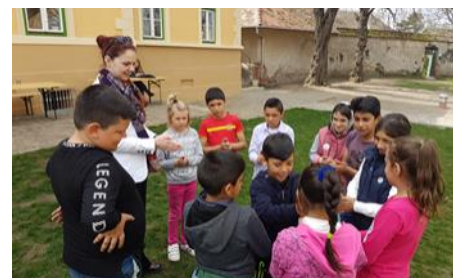
Jocuri la Proiectul Gusterita Verde - Biserica Evanghelica